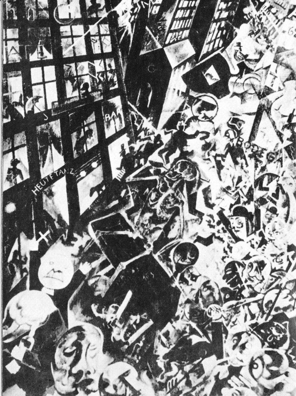
George Grosz Widmung an Oskar Panizza (1917/18)