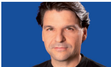
Chefdirigent Ernst Theis übernimmt die musikalische Leitung des Neujahrskonzertes.

Zum Neujahrskonzert „Alles Rhythmus!“ erklingen nicht nur Musikinstrumente.