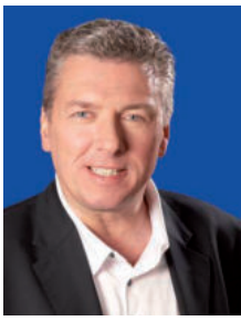
Intendant Wolfgang Schaller

Es ist kaum zu glauben, aber Weihnachten steht bald wieder vor der Tür. Schon in wenigen Tagen wird auf dem Altmarkt der Dresdner Striezelmarkt eröffnet werden. Ein untrügliches Zeichen dafür, dass (hoffentlich) bald der erste Schnee fallen wird – und wir noch Geschenke besorgen müssen. Dass Karten für die Staatsoperette Dresden immer ein schönes Geschenk sind, muss ich Ihnen als Leser des Buffo ja nicht eigens sagen.