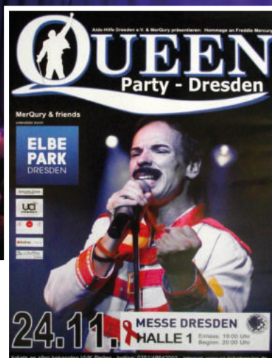
Die Queen-Party 2011: „Eine Nacht für Freddy“ im Kulturpalast

Jedes Jahr kommen Künstler aus unterschiedlichen Genres von Rock, Pop, Jazz bis zu Klassik zusammen nach Dresden, um mit MerQury auf der Bühne ihre eigenen Interpretationen der unsterblichen Hits von Queen zu präsentieren.