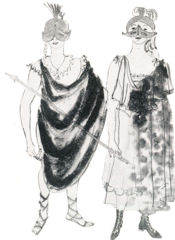
Ballett, römische Krieger