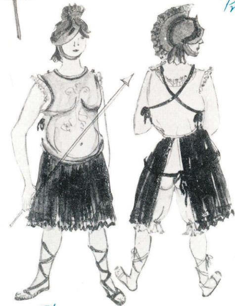
Ballet, römische Krieger